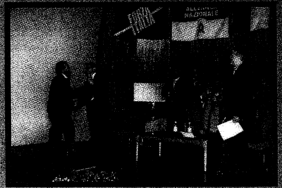
Auditorium S. Francesco - 9 maggio 2004

Siamo consapevoli delle difficoltà e delle sfide che il mercato globale pone a questo settore. Occorre pertanto realizzare una serie di azioni mirate per far tornare uno dei nostri principali settori economici in una posizione di forza sul mercato; c'è quindi bisogno di scelte politiche coraggiose.